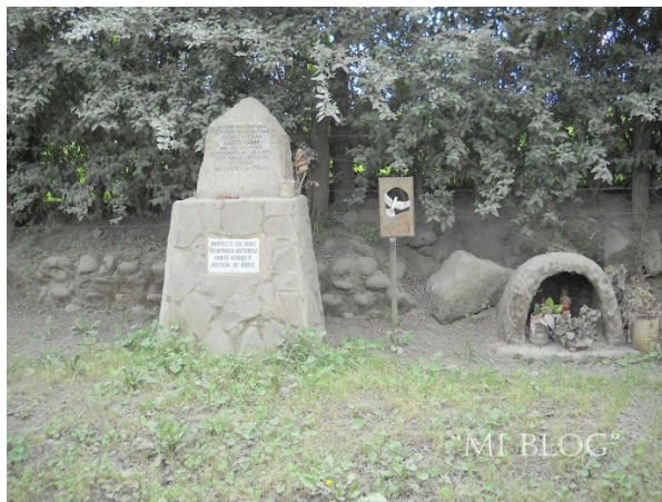
Imagen 4. Memorial Fundo Tanilvoro.

lugar donde murió. Posteriormente se instaló un monolito construido en piedra y que representó a una víctima de la dictadura.