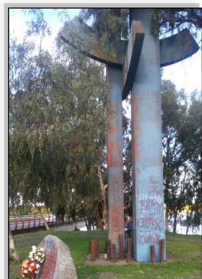
Imagen 3. Memorial Puente El Ala.

El memorial, al haber sido emplazado en un lugar alejado de la ciudad, impide la comunicación con los grupos sociales, remitiendo su uso a quienes pasan por el lugar. Este espacio, frecuentado principalmente por las familias de las víctimas, demuestra que su construcción no posibilitó manifestaciones de tipo cultural por parte de la población que se desplazaba en la zona, producto de su lejanía con el radio urbano. Desde el aspecto positivo y emotivo, este memorial, que se presentó como monumento y marca territorial –dado su tamaño y origen-, no fue un espacio que generara odio y dolor, sino por el contrario, producto de las condiciones naturales otorgadas, se perfiló como un lugar apacible, donde las personas tuviesen permitido la interacción, y se le confirió el uso de área de descanso.