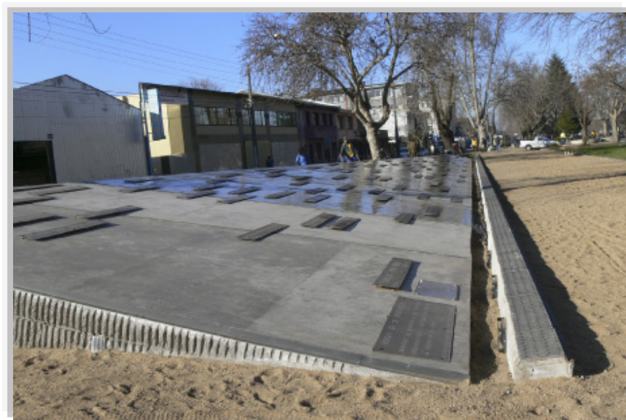
Imagen 2. Memorial de Chillan, Pátina de Agua y Piedra de los Detenidos desaparecidos de Chillán.

cuales se encuentran ubicados en el bandejón Central de Avenida Brasil entre las Calles de Libertad y Bulnes frente a estación de ferrocarriles 26 .